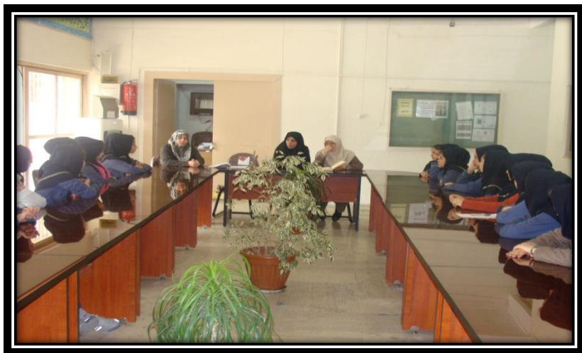
جلسات مشاوره ای با دانش آموزان